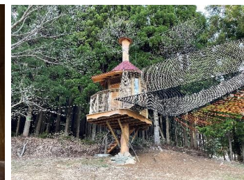
コテージ横のツリーハウス