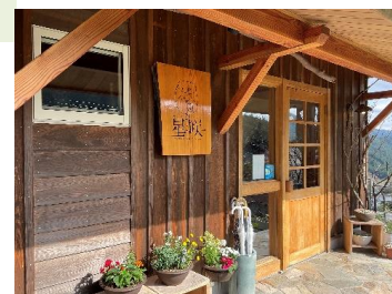
オーベルジュ外観

これまで2人だけで事業を行いたいという思いが強く、コテージの運用含め2人でやることに執着していました。しかし、この美しい景色が地域の皆様によって維持されていることに気づき、景色を守るためにも、人を雇い地域の雇用を支えていきたいと思うようになりました。今後、自分たちだけではなく、屏風岩一帯として盛り上げていきたいと思っています。