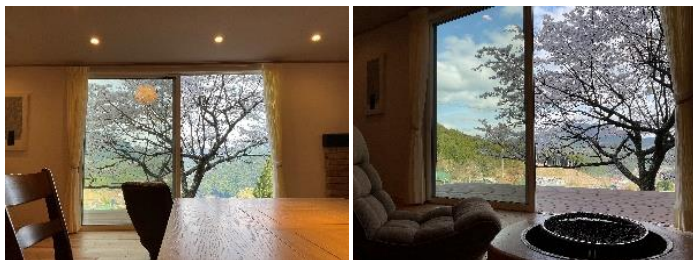
コテージからの桜の景色