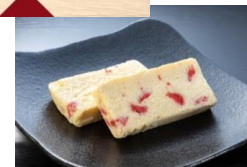
↑チーズケーキの木箱とカード