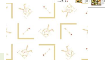
↑仕出し冊子と包装紙