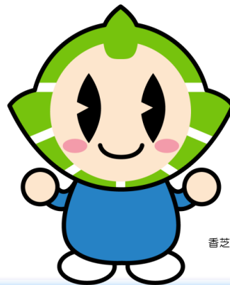
香芝市マスコットキャラクター 『カッシー』

香芝市がお客様に代わり、負担いたします。 ※実質、お客様にお支払いいただく保証料は、 0.13～0.57%になります。