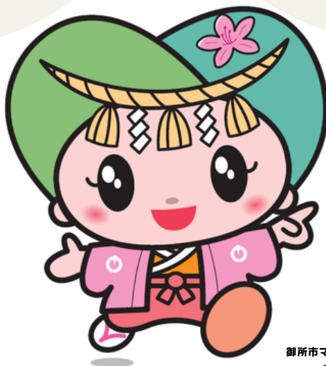
御所市マスコットキャラクター 『ゴセンちゃん』